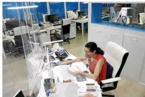
Blindaje. Las oficinas aparecen blindadas por mamparas de metacrilato, en especial las áreas en las que se atiende directamente al público y entre puestos de trabajo.